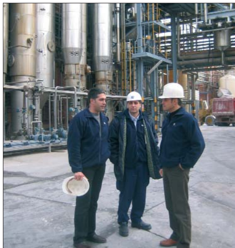
El equipo responsable del desarrollo del proyecto de automatización de la planta de Purac

Una vez desarrollado el proyecto, y para aprovechar al máximo todas las posibilidades