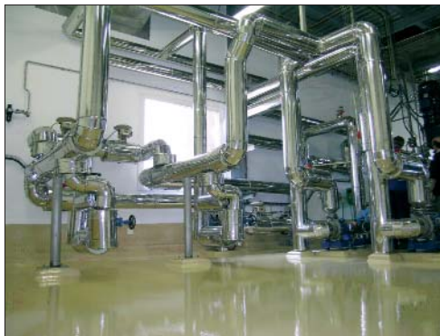
Planta de Purac en Montmeló

Entre los objetivos planteados al inicio del proyecto se marca, en primer lugar, conseguir un "tiempo de parada cero" en planta para maximizar los beneficios de la producción. Junto con ello, se pretende mejorar la eficiencia de la fábrica y conseguir un análisis de la información más efectivo para poder responder a un mercado en constante demanda. Además, se busca mantener las funcionalidades de control en tiempo real así como gráficas y tendencias de la producción. Como requisito, la implantación debía ser de la manera más rápida y menos traumática posible.