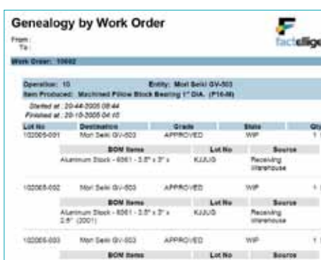
Figure 3: Wonderware Operations Software offre un'ampia gamma di report web-based pre-configurati.

L'intero impianto produttivo risulta più efficiente se il personale, a tutti i livelli, ha accesso ad informazioni sulla produzione in tempo reale. Wonderware Operations Software è integrato con Wonderware InTouch e Wonderware System Platform per acquisire e presentare al personale informazioni produttive complete attraverso un'interfaccia utente intuitiva. Wonderware Operations Software, inoltre, è integrato con Wonderware Information Server, per fornire report di produzione a chiunque sia dotato di un accesso internet e necessiti di avere informazioni aggiornate. Wonderware Information Server può essere configurato in maniera tale da rendere disponibile ad ogni utente/gruppo di utenti esclusivamente il set di informazioni pertinente al proprio lavoro.