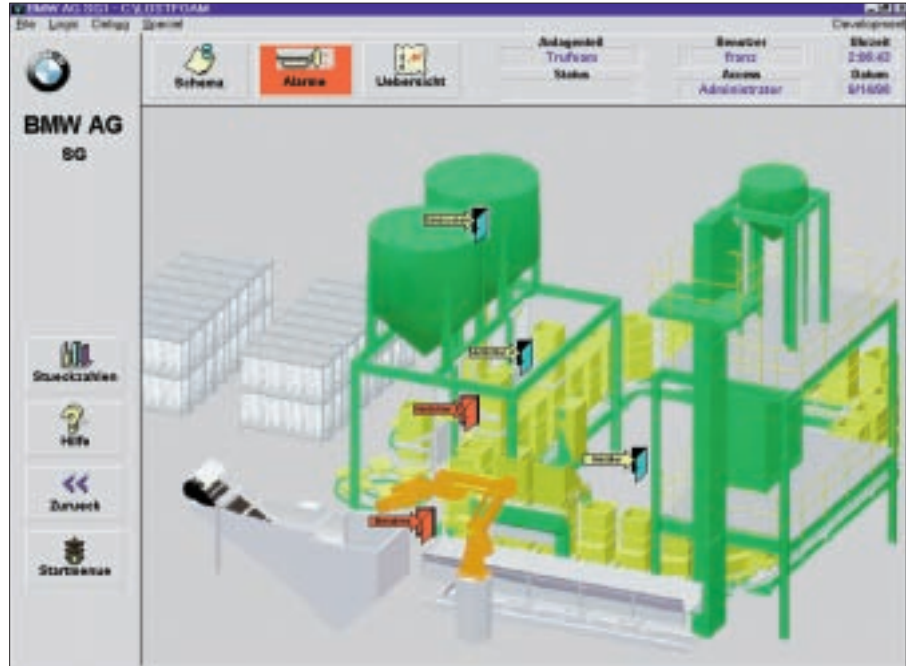
Übersichtsmaske am Leitstand

Sämtliche Maschinensteuerungen sind über TCP/IP an den InTouch-Leitstand gekoppelt. Dieser hat die Aufgabe, alle relevanten Prozeßdaten aus den 15 angeschlossenen Steuerungen zu lesen und Rezepturen in die Steuerungen zu schreiben. Weiterhin dient der Leitstand zur Überwachung der Gesamtanlage, der Übertragung von Zählerständen, Störmeldungen sowie ausgewählten Prozeßdaten in die Produktionsdatenbank (IndustrialSQL Server) und an die Bedien- und Beobachtungsstationen (InTouch-Clients) in der Werkstatt und im Meisterbüro.